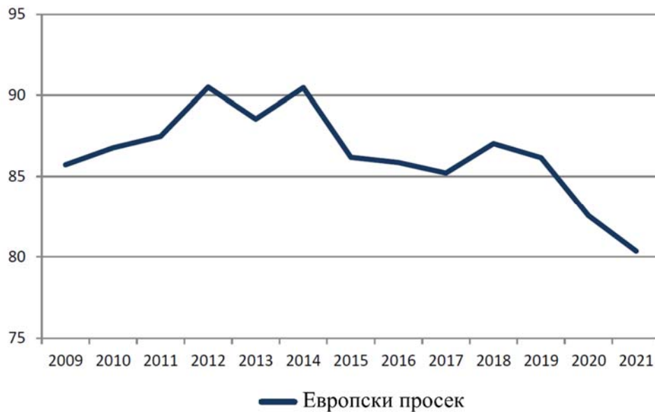
Слика 2. Тренд опадања квалитета преноса приоритетних пошљака за рок Д+1

С друге стране, а на основу ERGP извештаја о будућим потребама УПУ, приказан је тренд смањења квалитета преноса пошљака за земље ЕУ, у периоду од 2009. до 2021. године (слика 2).