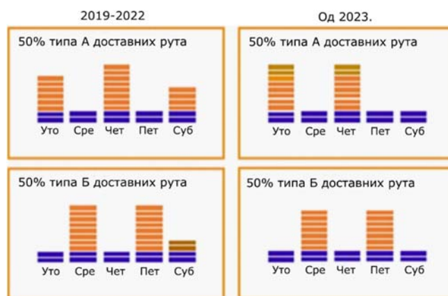
Слика 3. Норвешки модел доставе

На основу приказаних података, видљиво је да највећи број земаља има петодневну доставу. Међутим, највећу промену је увела Норвешка, која наизменично ради уручење: понедељак, среда, петак једне недеље, а онда уторак, четвртак друге недеље. Од 2023. године уводе се и даље промене, где недељно постоје само два вршна дана када се врши достава на 50% доставних рута и још два дана када се врши достава на преосталих 50% доставних рута. Суботом се врши достава само приоритетних писама (слика 3).